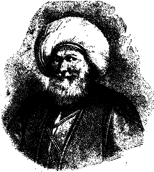
محمد علي الكبير منشئ الوقائع المصرية